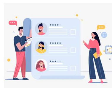
People Team 人力資源