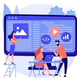
Product Management 產品管理