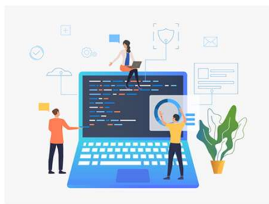
Business Intelligence 數據分析