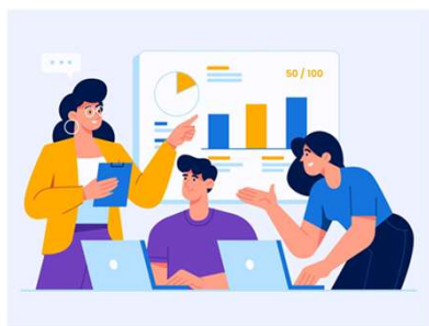
Business Development 商業發展