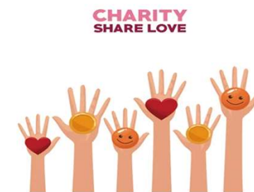
Corporate Affairs 企業事務