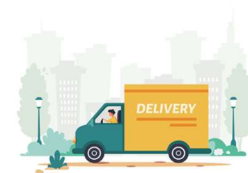
Shopee Xpress 蝦皮店到店